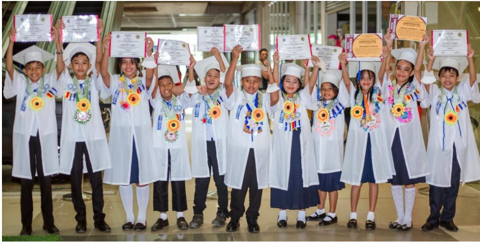
Die 6. Klässler haben nochmals 6 bis 10 Jahre Schule vor sich!