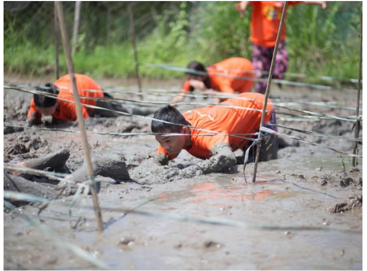
Summer camp auf der Bio-Farm: Spiele, Parcours, Rollenspiele, Basteln und Information zu Empfängnisverhütung – ein vielfältiges Programm erwartete die 14-16-jährigen.