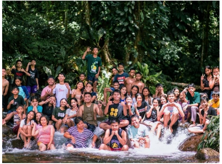
Tagesausflug an einen Fluss mit Wasserfällen