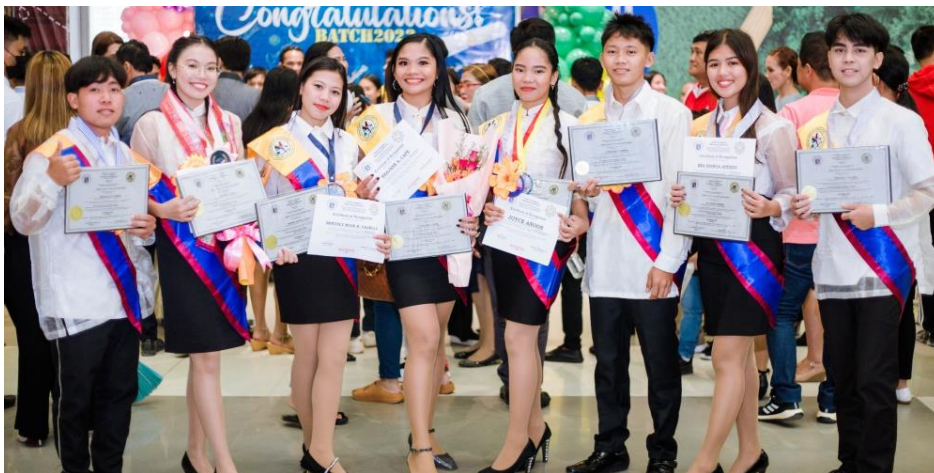
Senior High Batulong StudentInnen